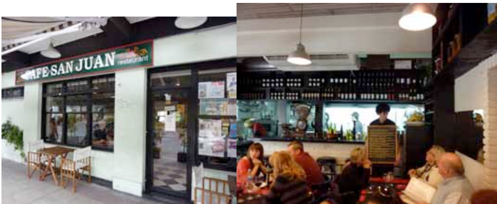
Café San Juan

Para comer en la región, recomendamos el Café San Juan (Avenida San Juan 450), un sencillo bistró familiar, con cocina a la vista, con pocas mesas (entran 25 personas, así que es importante reservar con antelación). Los platos, tradicionales y modernos están detallados en la pizarra, y además ofrece una excelente carta de vinos y una buena atención. Una vez más: es importante reservar por teléfono (4300-1112/4307-2746).