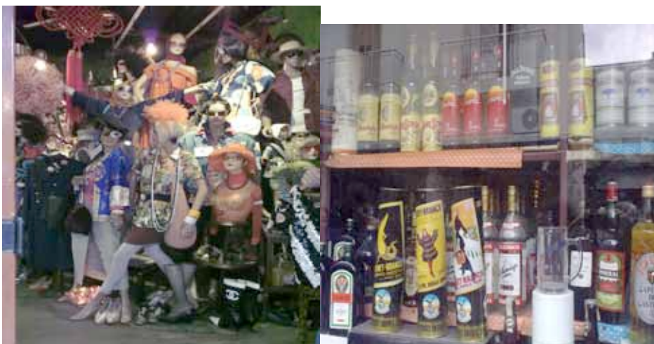
Vidrieras de San Telmo

Es la zona en la que se fundó la ciudad, cerca de Plaza de Mayo. Todavía se conservan muchas de las antiguas construcciones como los conventillos, casas “tipo chorizo” (alargadas y con un patio lateral) y viejos almacenes. Los domingos hay una feria de antigüedades en la Plaza Dorrego . La feria es un point turístico: está llena de extranjeros, hay espectáculos callejeros bien variados desde performances y marionetas, hasta músicos y bailarines de tango. Muy recomendable para aquellos, a los que les gustan las ferias. Por la calle Defensa , en dirección a la Avenida Belgrano hay varias galerías y puestos de venta de antigüedades y antigüedades recién envejecidas .