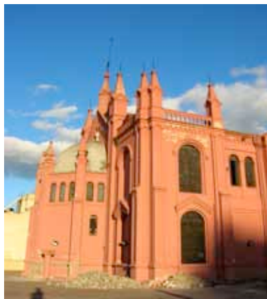
Centro Cultura Recoleta

Ver si se puede subir a la terraza del edificio (que normalmente se encuentra clausurada). Desde allí hay una excelente vista del cementerio, de la Iglesia del Pilar y de la plaza.