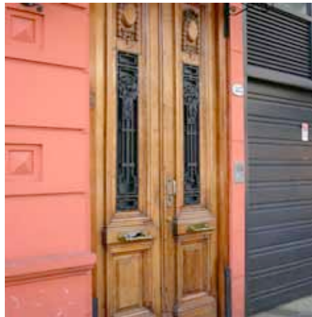
Calle Cabrera – Palermo Viejo

etc.) y restaurantes, todos muy modernos, con propuestas bien variadas y, la mayoría, con precios razonables. Como muchos de los restaurantes son lugares de moda, hay que tener un poco de cuidado para no pagar mucho y comer más o menos.