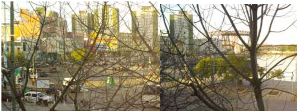
La Boca. Vista desde la Fundación PROA

Para comer, recomendamos El Obrero (Calle Agustín Caffarena), un restaurante tradicional de la Boca frecuentado originalmente por sus vecinos y que, en los últimos años, adquirió fama internacional y actualmente atrae muchos turistas.