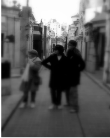
Cementerio de la Recoleta

El Cementerio de la Recoleta es un lugar habitualmente visitado por turistas y locales. Allí están todos los héroes nacionales y muchos “ricos y famosos”. No será Père Lachais, pero merece un paseo corto.