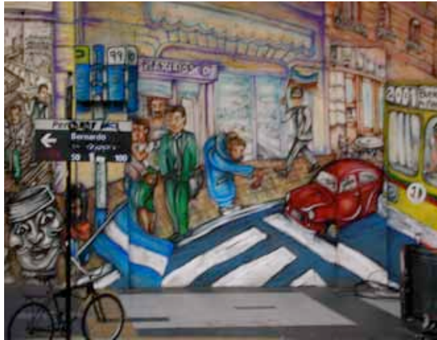
Graffiti porteño – Bernardo de Yrigoyen y Avenida de Mayo.

· Las fotografías que aparecen en esta guía son propiedad de los autores y no pueden reproducirse sin autorización previa.