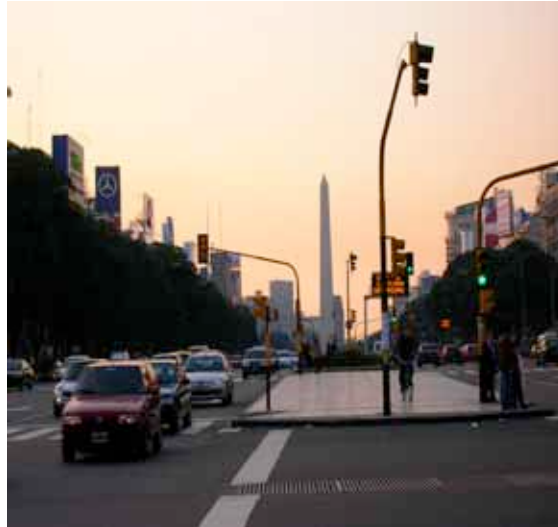
Avenida 9 de Julio y Obelisco